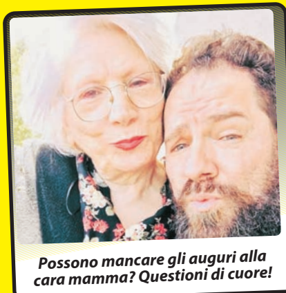
Possono mancare gli auguri alla cara mamma? Questioni di cuore!